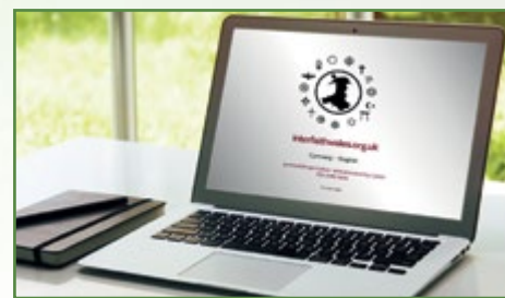
Cytûn sy'n rheoli gwefan Rhyng-Ffydd Cymru, nodwch yr enw parth newydd: www.interfaith-wales.org.uk

Mae Cytûn yn parhau i ddarparu cymorth gweinyddol i Gyngor Rhyng-Ffydd Cymru. Mae gwaith y Cyngor yn berthynol o ran natur yn adeiladu ar ysbryd o barch, cyfeillgarwch a chydweithrediad. Cynhaliwyd cyfarfodydd yn addoldai ein gilydd - yn enwedig yn ystod yr Wythnos Rhyng-Ffydd ym mis Tachwedd.