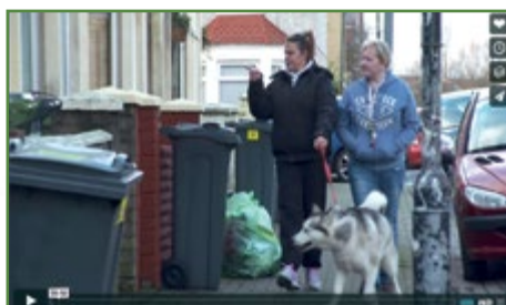
Clip fideo 'Tai a Thlodi' o wefan Cytûn, un o'r fideos a'r adnoddau a gynhyrchwyd ar gyfer Etholiad Cyffredinol Cymru

Mae galluogi'r eglwysi i ymateb yn briodol i ddyfodiad ceiswyr lloches a ffoaduriaid i Gymru wedi bod yn flaenoriaeth nodedig. Mae Cytûn hefyd wedi cadw ffocws parhaus yn y maes cyhoeddus ar heriau hirdymor ym mywyd cyhoeddus Cymru, gan gynnwys datblygu economaidd, addysg, iechyd, bywyd gwledig, cydlynad cymdeithasol a materion yn ymwneud â'r iaith Gymraeg. Parhawyd i gynnal y cyswllt gyda sefydliadau allweddol fel Ymddiriedolaeth Trussell. Yn aml, gofynnir i staff Cytûn fod yn siaradwyr allweddol mewn digwyddiadau, fel Diwrnod i Ffwrdd staff Cartrefi Cymunedol Gwynedd a gynhaliwyd ym Mhwlheli ym mis Gorffennaf.