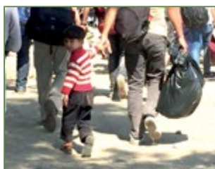
Cefnogi ceiswyr lloches a phlant sydd ar eu pen eu hunain

Drwy waith ei Banel Dyngarol mae cefnogaeth wedi ei rhoi i Urdd Gobaith Cymru, wrth i'r mudiad ganolbwyntio ar sefyllfa'r ffoaduriaid drwy ei neges ewyllys da, a'r gwasanaethau a deunydd litwrgaidd a ddarperir ar gyfer Sul yr Urdd. Mae gan yr Urdd dros 50,000 o aelodau.