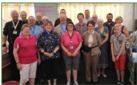
Gwirfoddolwyr y stondin 'Cytûn: Eglwysi Ynghyd' yn y Sioe, Llanelwedd, Gorffennaf 2016

Mae'r adroddiad hwn wedi cael ei baratoi yn ystod yr Adfent 2016, ac maen cynnig dathlu a myfyrio ar flwyddyn brysur arall yn gwasanaethu ein sefydliadau a'n heglwysi sy'n aelodau. Mae gwaith staff Cytûn yn cael ei ffurfio drwy lunio cynllun gwaith blynyddol. Bron yn ddiethriad, mae'r gwaith hwnnw y cytunwyd gan yr eglwysi, yn ystod y blynyddoedd diwethaf, wedi cael ei gyflwyno yn ei gyfanrwydd a'i gyflawni o fewn y gyllideb. Mae Cytûn bob amser yn ceisio ymateb i geisiadau oddi wrth yr eglwysi wrth i amgylchiadau a blaenoriaethau newid. Mae hynny wedi rhoi i offeryn eciwmenaid cenedlaethol Cymru y cyflymder i weithredu sydd wedi bod o fudd mawr i eglwysi unigol a'r teulu Cristnogol ehangach.