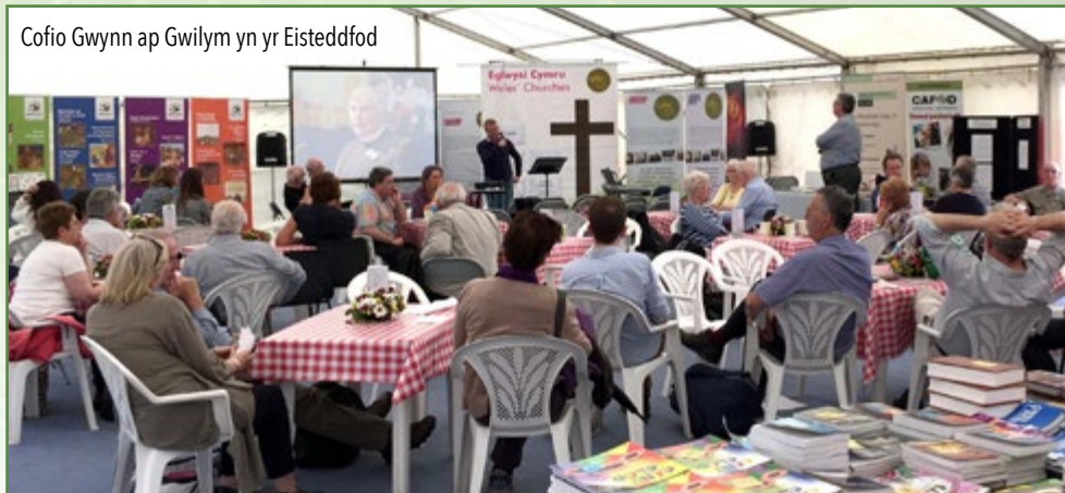
Cofio Gwynn ap Gwilym yn yr Eisteddfod

Mae'r flwyddyn hon wedi bod yn eithriadol, mewn cymaint o wahanol ffyrdd. Mae Cytûn wedi ceisio helpu'r eglwysi i ymateb gyda'i gilydd i ddigwyddiadau fel cynnal Etholiad Cyffredinol Cymru, refferendwm ar aelodaeth o'r Undeb Ewropeaidd, a chyhoeddi drafft newydd Bil Cymru.