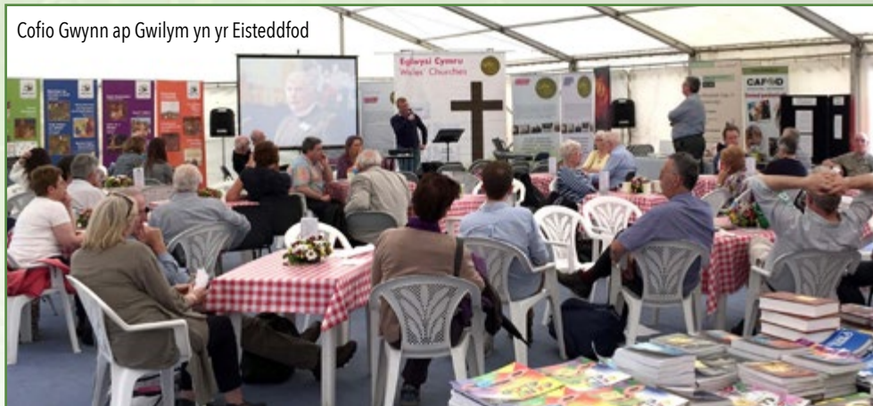
Cofio Gwynn ap Gwilym yn yr Eisteddfod

Mae'r flwyddyn hon wedi bod yn eithriadol, mewn cymaint o wahanol ffyrdd. Mae Cytûn wedi ceisio helpu'r eglwysi i ymateb gyda'i gilydd i ddigwyddiadau fel cynnal Etholiad Cyffredinol Cymru, refferendwm ar aelodaeth o'r Undeb Ewropeaidd, a chyhoeddi drafft newydd Bil Cymru.