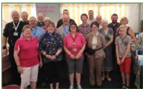
Gwirfoddolwyr y stondin 'Cytûn: Eglwysi Ynghyd' yn y Sioe, Llanellwedd, Gorffennaf 2016

Mae'r adroddiad hwn wedi cael ei baratoi yn ystod yr Adfent 2016, ac maen cynnig dathlu a myfyrio ar flwyddyn brysur arall yn gwasanaethu ein sefydliadau a'n heglwysi sy'n aelodau. Mae gwaith staff Cytûn yn cael ei ffurfio drwy lunio cynllun gwaith blynyddol. Bron yn ddiethriad, mae'r gwaith hwnnw y cytunwyd gan yr eglwysi, yn ystod y blynyddoedd diwethaf, wedi cael ei gyflwyno yn ei gyfanrwydd a'i gyflawni o fewn y gyllideb. Mae Cytûn bob amser yn ceisio ymateb i geisiadau oddi wrth yr eglwysi wrth i amgylchiadau a blaenoriaethau newid. Mae hynny wedi rhoi i offeryn eciwmenaidd cenedlaethol Cymru y cyflymder i weithredu sydd wedi bod o fudd mawr i eglwysi unigol a'r teulu Cristnogol ehangach.